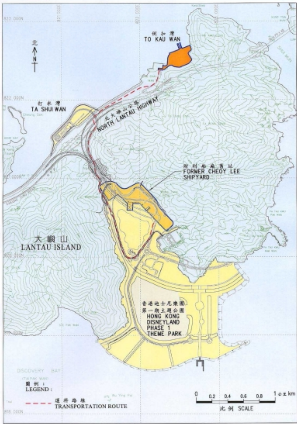
Title 附件甲 Annex A 位置圖 LOCATION PLAN