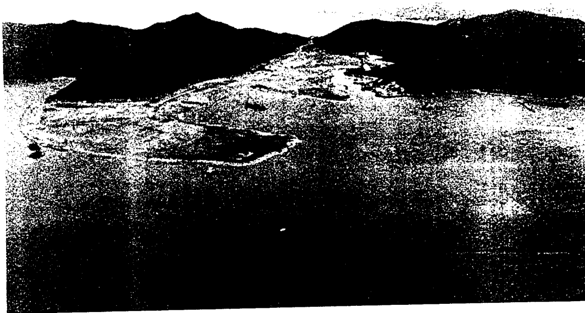
Reclamation Works at Penny's Bay (Outer Bay View) (Progress as at end-November 2001) 竹篙灣（外灣）填海工程進度（截至二零零一年十一月底）