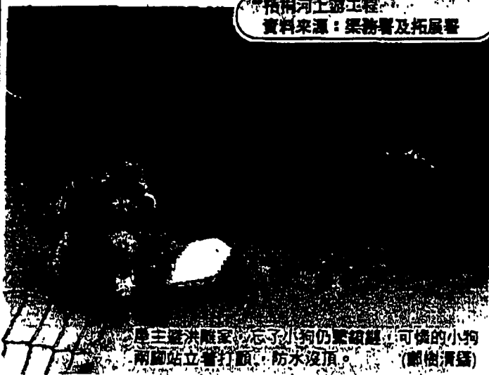
屋主避洪離家，忘了小犬仍繫鎖鏈，可憐的小狗兩腳站立著打顫，防水沒頂。