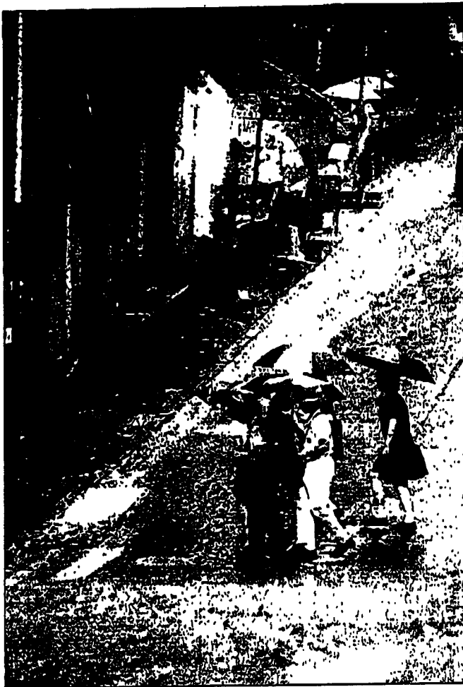
昨日早上大雨，許多學生需冒雨上學。

昨八鄉元崗新村凌晨四時許已出現水浸，一對老人家報警指水浸入屋被困，消防人員帶來裝備入村救人，但最後事主不願離開。另外，村民出入都要涉水，有人索性把鞋除掉。另外，在東涌牛坳村救出一名女子。而在深井村，一架私家車凌晨時分，失事跌下引水道，司機以及一名乘客自行爬出車外，手腳輕傷，無傷送院。