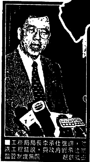
工務局局長李承仕強調，防洪工程延誤，與政府對承建商監管制度無關。