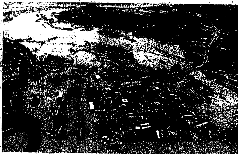
新界北一小時內下了一百毫米雨量，從直升機俯瞰，梧桐河一帶已為澤國。