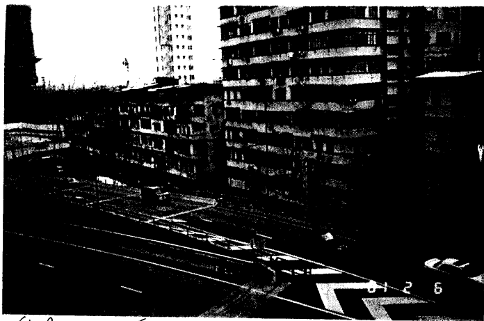
受影响大厦 A 3座大厦