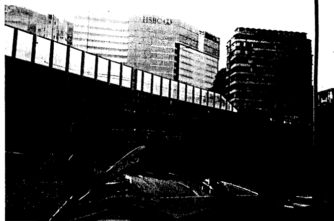
连接西九龍天橋 新橋面隔音屏