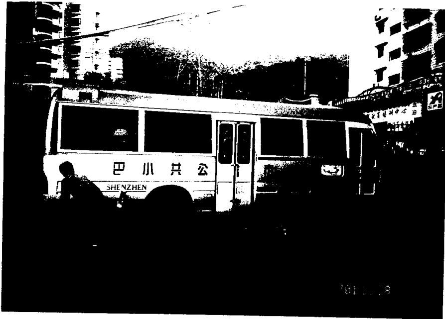
深圳小巴連司機 22 座