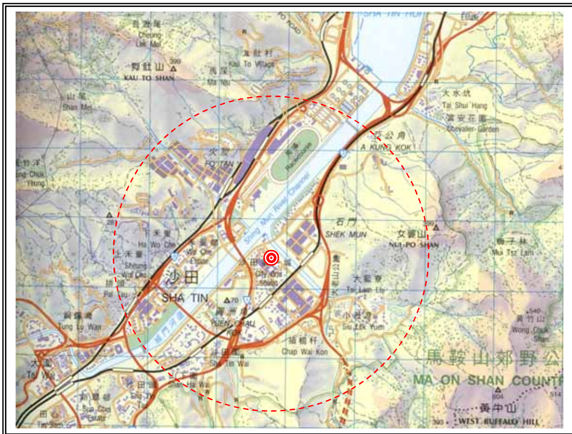
沙田第一城兩公里半徑範圍圖示(假設日本腦炎患者居於此)(地圖比例: 1:50 000)