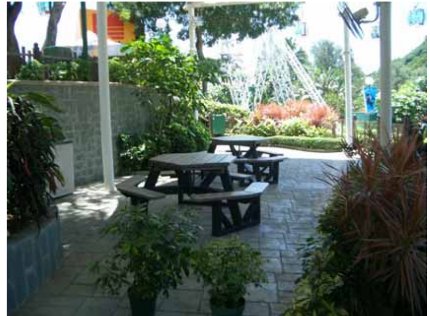
(the lower platform sitting-out area)