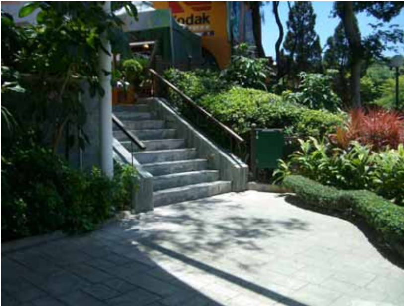
(staircase leading from Cable Car Plaza upper platform to the lower platform sitting-out area)