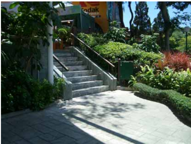
(連接登山纜車廣場高層及低層休憩處的樓梯)