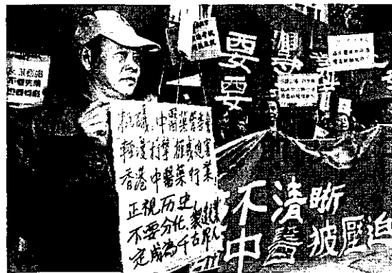
中醫為爭取合理權益，多次上街遊行。

要先「鬆鬆」積存的瘀血，再引帶出外，但這方法，現時新興的中醫學院，根本沒有人懂，遑論有人