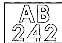
圖 1A 。