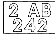
圖 2A 。