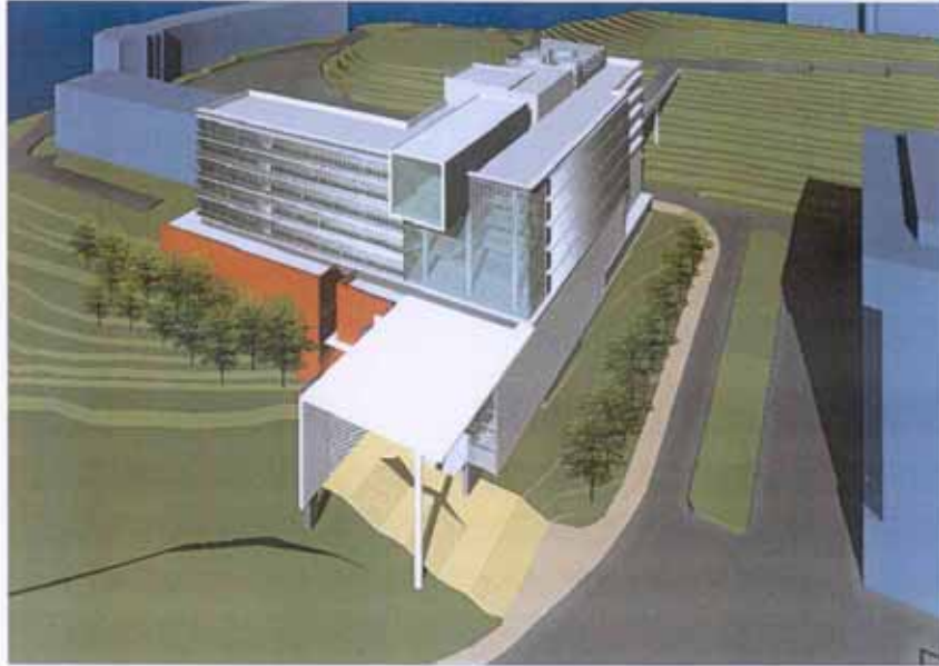
從東南面望向教學大樓的構思圖 View of the teaching complex from south-eastern direction (artist's impression)