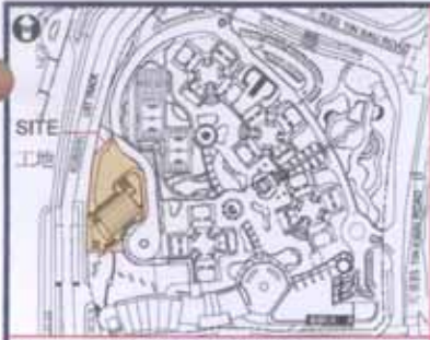
位置圖 LOCATION PLAN 比例 scale 1:5000