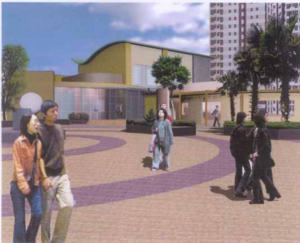
從東南面望向擬建社區會堂的構思圖 VIEW OF THE PROPOSED COMMUNITY HALL FROM THE SOUTH-EAST DIRECTION