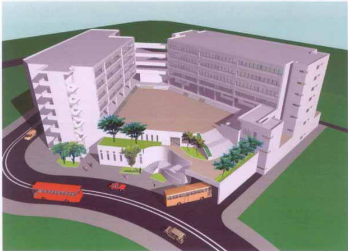
VIEW OF THE SCHOOL PREMISES FROM NORTHERN DIRECTION (AERIAL VIEW) 從北面望向校舍的鳥瞰效果圖

54EC - A PRIVATE INDEPENDENT SCHOOL (SECONDARY-CUM-PRIMARY) IN AREA 11, SHA TIN 沙田第11區的1所私立獨立學校(中學暨小學)