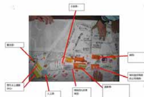
參與式設計的模型之一：(可按圖放大)