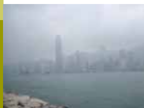
很多時候都不見天日的海港