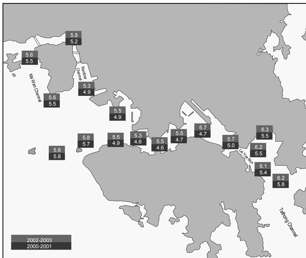
圖 2 淨化海港計劃 17 個加強水質監測站錄得溶解氧量(毫克/公升)變化圖(比較二零零二年一月至二零零三年十二月與二零零零年一月至二零零一年十二月的平均差距)