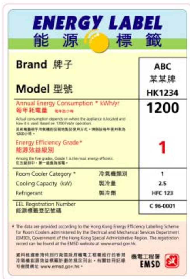
“級別式”能源標籤樣本

“級別式”能源標籤把同一類產品的能源效益分為五級。“第1級”標籤代表在市面上能源效益最高；“第3級”標籤代表能源效益一般；“第4級”和“第5級”標籤代表能源效益低於市面上一般產品。