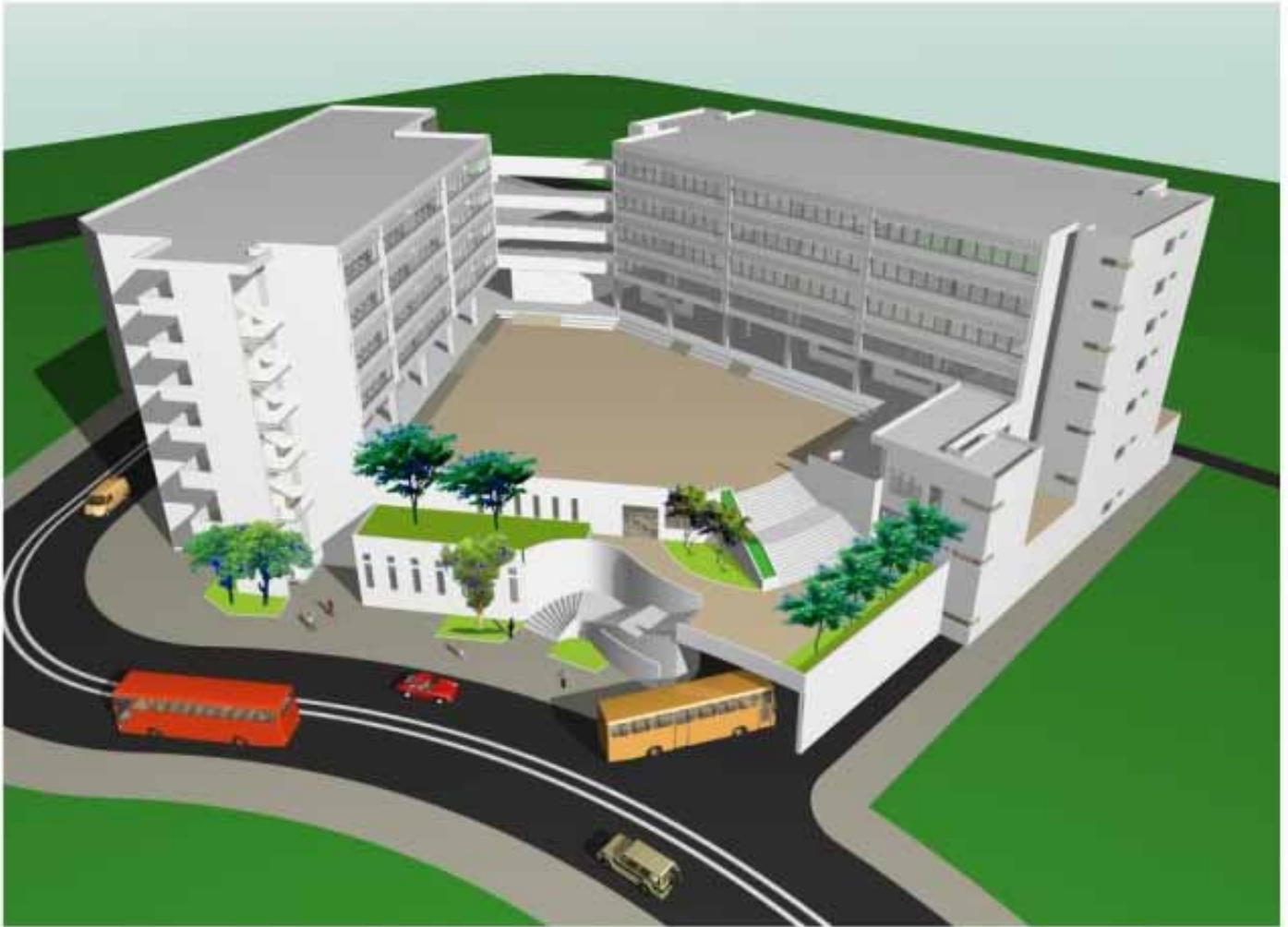
VIEW OF THE SCHOOL PREMISES FROM NORTHERN DIRECTION (AERIAL VIEW) 從北面望向校舍的鳥瞰效果圖

54EC - A PRIVATE INDEPENDENT SCHOOL (SECONDARY-CUM-PRIMARY) IN AREA 11, SHA TIN 沙田第11區的1所私立獨立學校(中學暨小學)