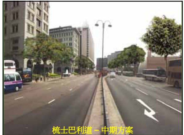
梳士巴利道 - 中期方案