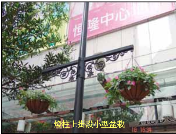
燈柱上掛設小型盆栽