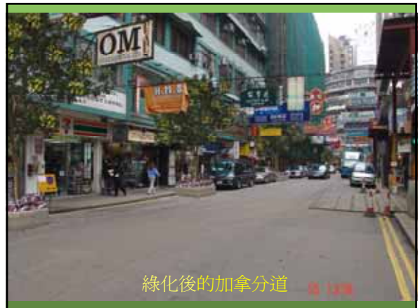
綠化後的加拿分道 攝 12/2008