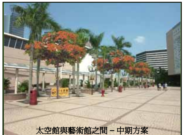
太空館與藝術館之間 - 中期方案