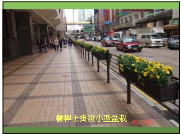
欄桿上掛設小型盆栽