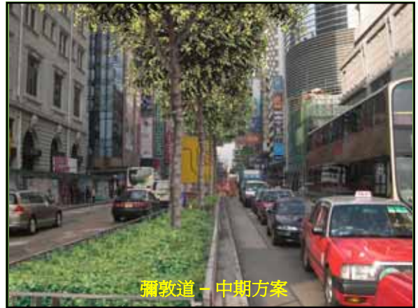
彌敦道 - 中期方案