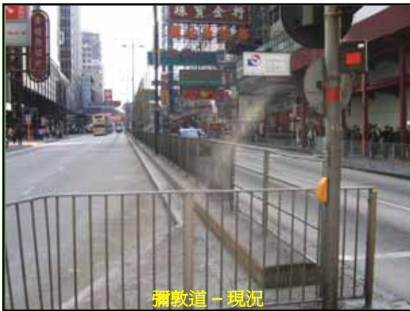
彌敦道 - 現況