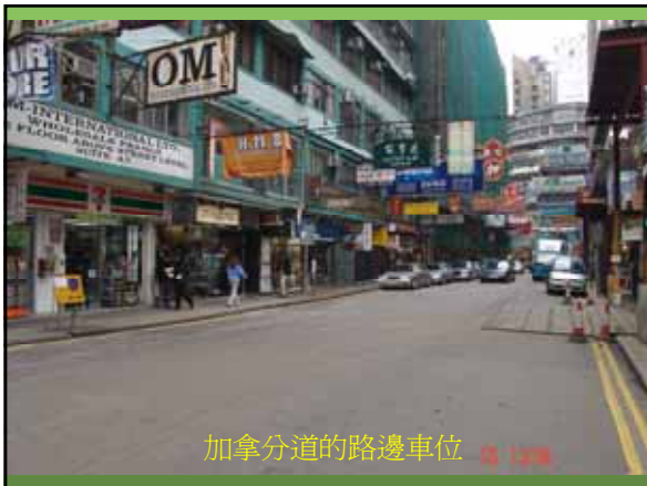
加拿分道的路邊車位 攝 12/2008