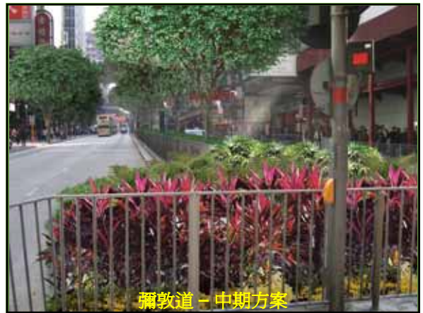
彌敦道 - 中期方案