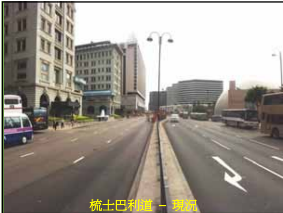
梳士巴利道 - 現況