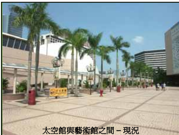
太空館與藝術館之間 - 現況