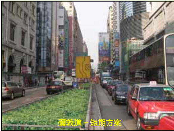
彌敦道 - 短期方案