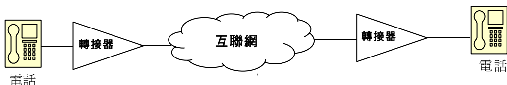
圖4 —— 電話至電話(b)

3.8 隨着相關技術的出現，IP電話近期以商業產品面世。IP電話是一個合成裝置，可直接接駁互聯網，無須裝配額外的軟件或硬件(例如轉接器)。