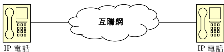
圖5 —— IP電話至IP電話

3.8 隨着相關技術的出現，IP電話近期以商業產品面世。IP電話是一個合成裝置，可直接接駁互聯網，無須裝配額外的軟件或硬件(例如轉接器)。