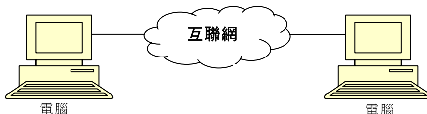
圖1 —— 個人電腦至個人電腦

3.2 個人電腦至個人電腦的電話服務是IP電話服務的最初模式。來電者與接收者必須將其個人電腦同時接駁互聯網，才可建立連繫，雙方並須使用兼容的軟件和硬件(例如多媒體電腦)。