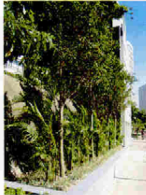
花槽種植 Planting in Planter