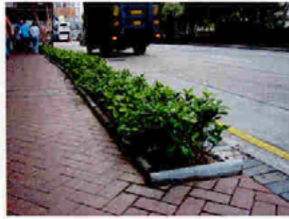
籬笆種植 Hedge Planting