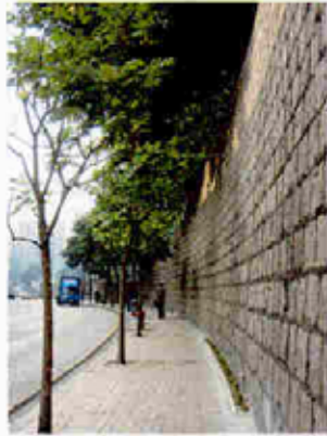
樹槽植樹 Tree Planting in Tree Pit