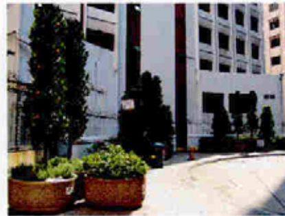
花盆種植 Planting in Movable Planter