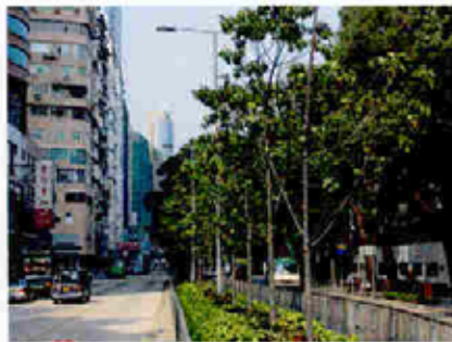
中央分隔帶種植 Planting in Central Median