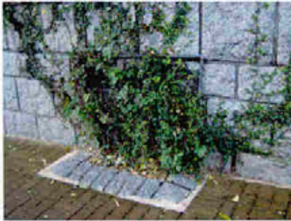
牆腳花槽種植攀緣植物 Climber Planting in Toe Planter