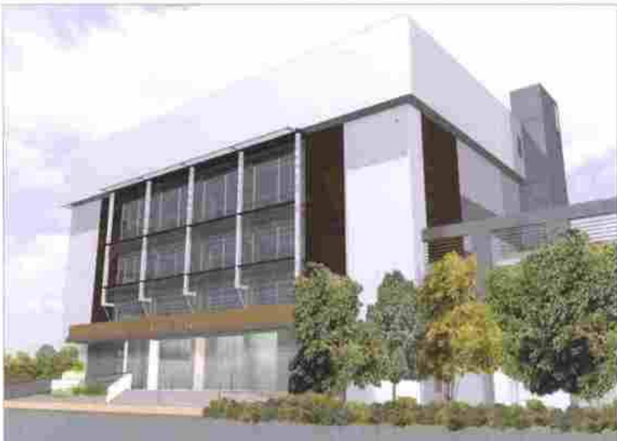
從南面望向勞資審裁處的構思圖 VIEW OF THE PROPOSED LABOUR TRIBUNAL BUILDING FROM SOUTHERN DIRECTION (ARTIST'S IMPRESSION)