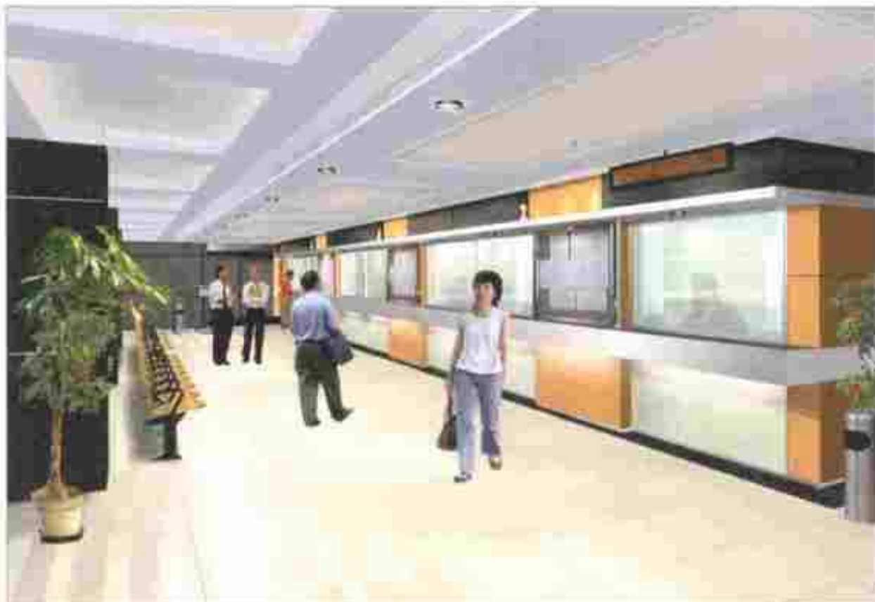
等候大堂的內部構思圖 INTERIOR OF PROPOSED WAITING HALL (ARTIST'S IMPRESSION)