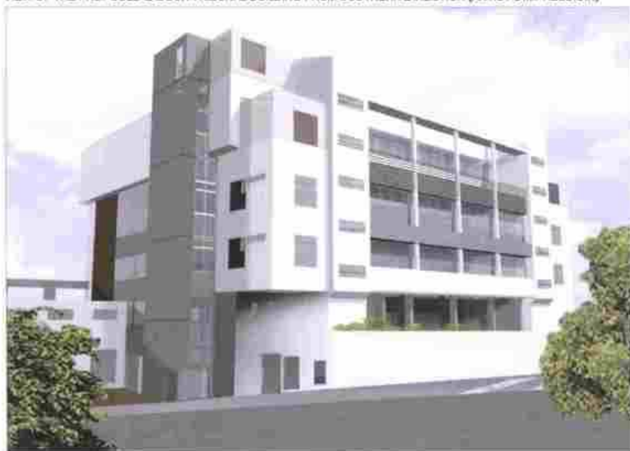
從東面望向勞資審裁處的構思圖 VIEW OF THE PROPOSED LABOUR TRIBUNAL BUILDING FROM EASTERN DIRECTION (ARTIST'S IMPRESSION)