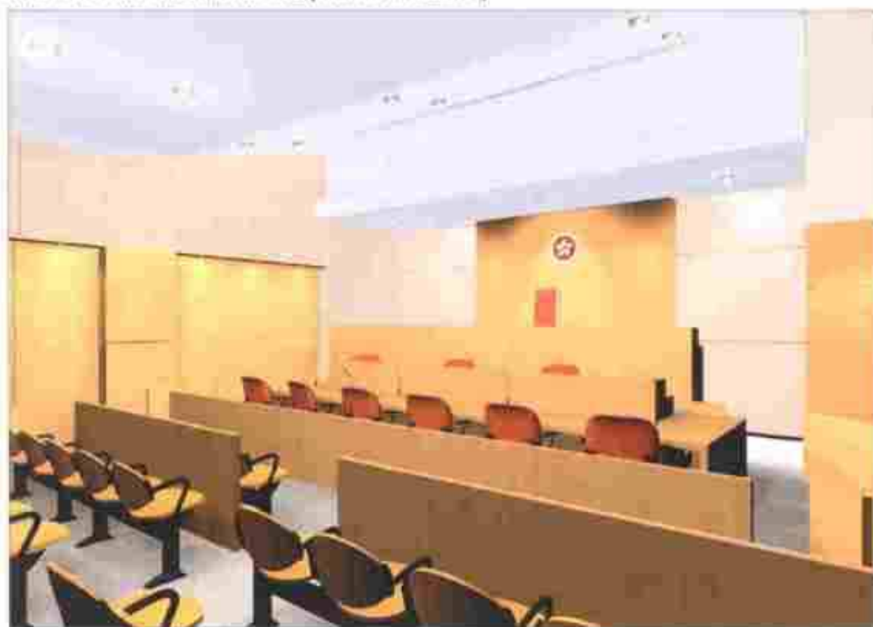
法庭的內部構思圖 INTERIOR OF PROPOSED COURT ROOM (ARTIST'S IMPRESSION)