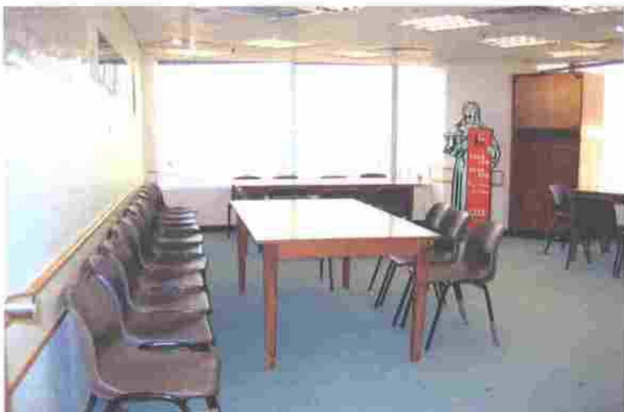
新勞資審裁處內為集體申索人士而設的會議室構思圖 Artist's Impression of the Conference Room for Group Claims in the new Labour Tribunal