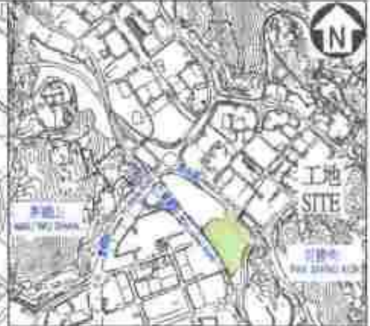
位置圖 LOCATION PLAN 比例 SCALE 1:10000