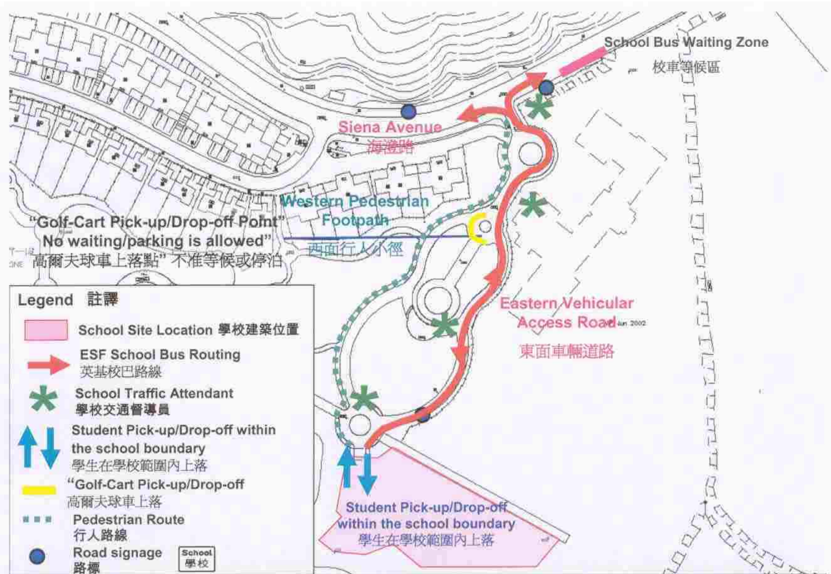
Operation of School Bus and Golf Cart during School Operation 學校運作期間校巴及高爾夫球車的運作