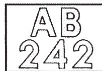
圖 1A 。