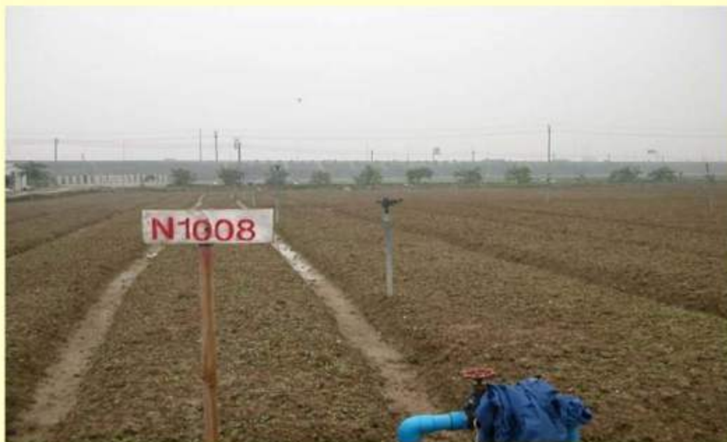
Choi Sum 菜心