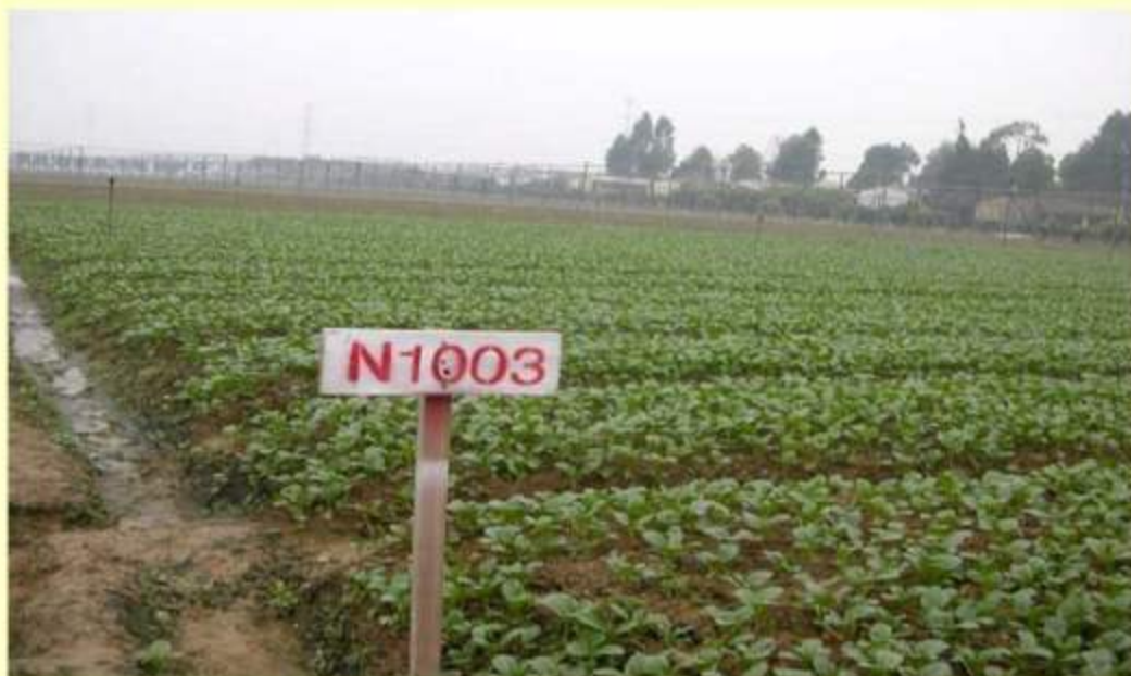
Pak Choi 白菜