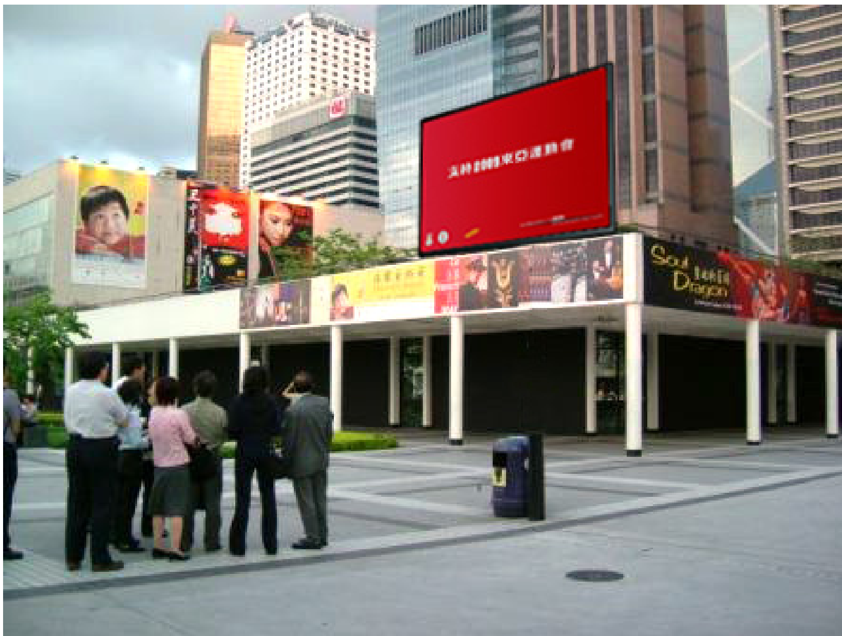
在大會堂（面向皇后碼頭）裝設 LED 顯示屏