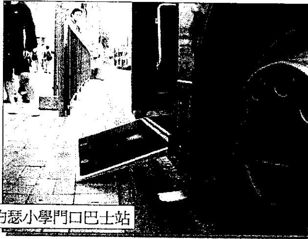
官塘道聖約瑟小學門口巴士站