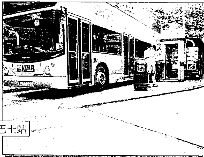
官塘月華街巴士站