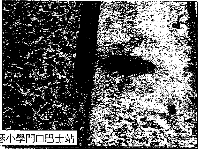
官塘道聖約瑟小學門口巴士站

巴士站連路壘也不足4吋的標準要求 “不足2吋” 導致低地台巴士的斜板太斜， 容易令輪椅翻車