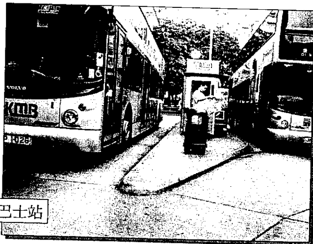
官塘月華街巴士站