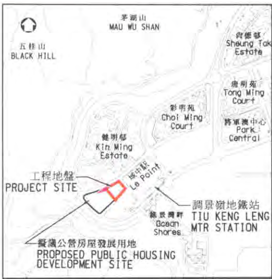
位置圖 LOCATION PLAN 比例 SCALE 1 : 20 000