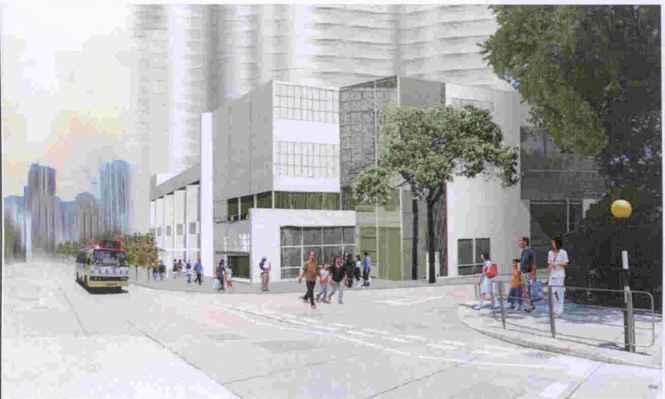
從西面望向擬建社區會堂及綜合家庭服務中心的構思圖 VIEW OF THE COMMUNITY HALL AND INTEGRATED FAMILY SERVICE CENTRE FROM WESTERN DIRECTION (ARTIST'S IMPRESSION)

Title 191SC COMMUNITY HALL AND INTEGRATED FAMILY SERVICE CENTRE AT TUNG TAU ESTATE PHASE 9, WONG TAI SIN 黃大仙東頭邨第9期的 社區會堂及綜合家庭服務中心