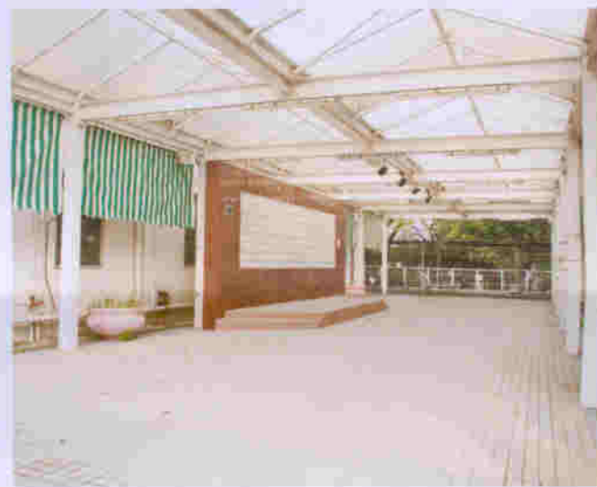
蒸康居每座之間空地被用作休憩及活動場地