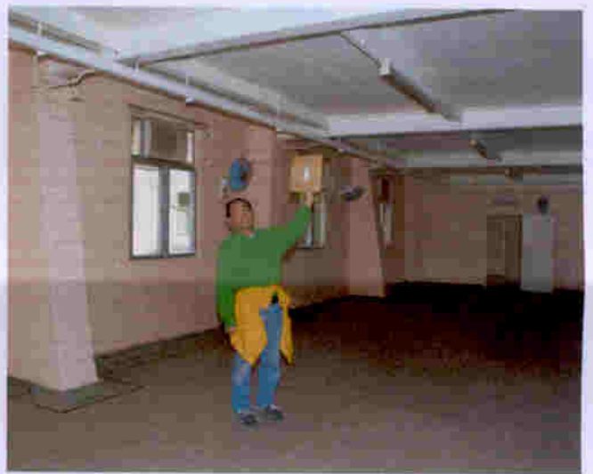
荔康居營房地下層基本情況一樣，保養良好