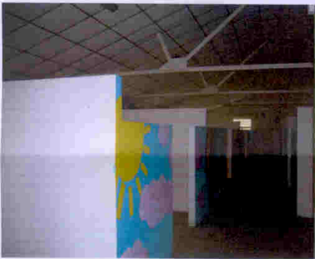
荔康居營房二樓情況，部份已有柵格和沐浴設施如圖，保養良好