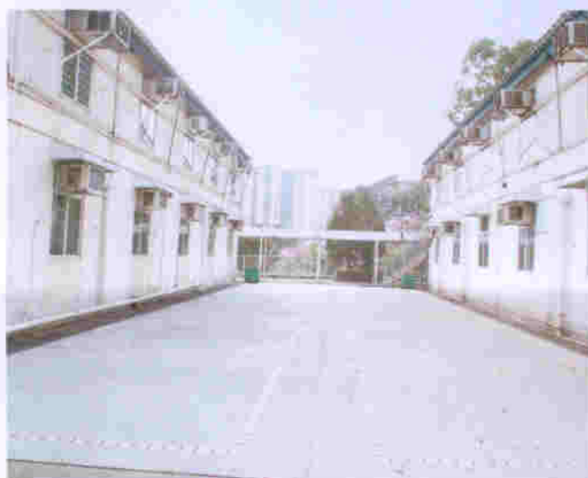
蕙康居的水、電、煤設施完備，全部冷氣機尚可運作