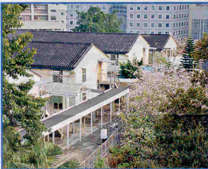
▲戰前軍營2層式樓房結構良好，裝修尚算嶄新，只需稍加粉飾及改裝即可使用。