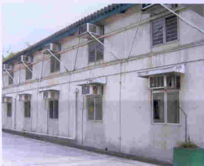
萬康居的水、電、煤設施完備，全部冷氣機尚可運作