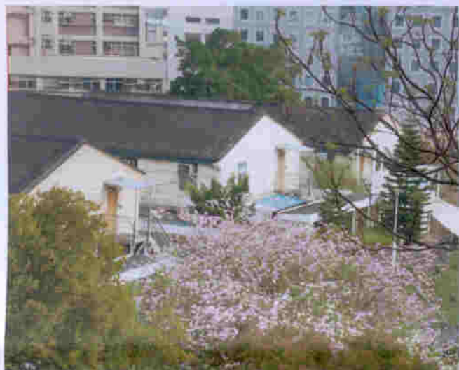
蕙康居位於市區，環境清幽古雅，交通方便，堪稱鳥語花香