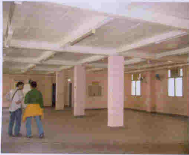
荔康居營房地下層基本情況一樣，設有男、女廁所，保養良好