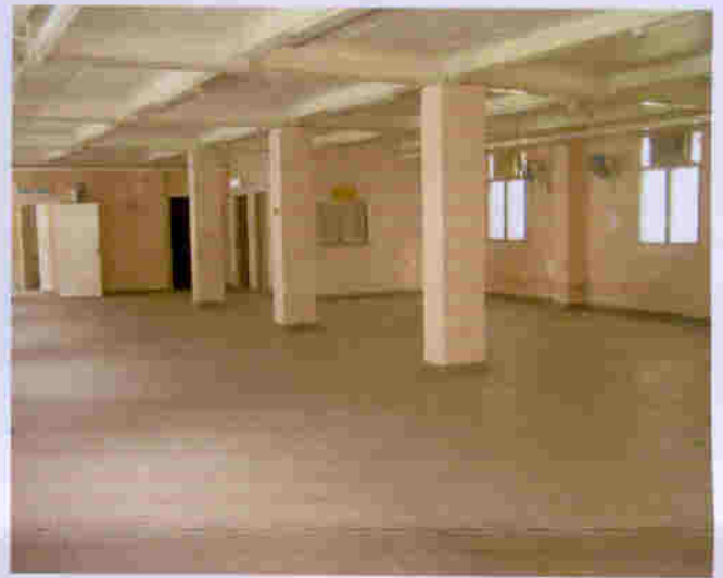
荔康居營房地下層基本情況一樣，設有男、女廁所，保養良好