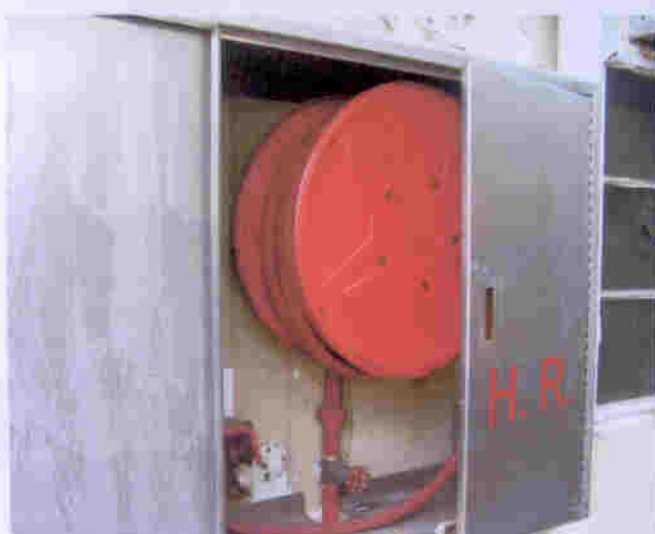
萬康居消防設施齊備，運作正常