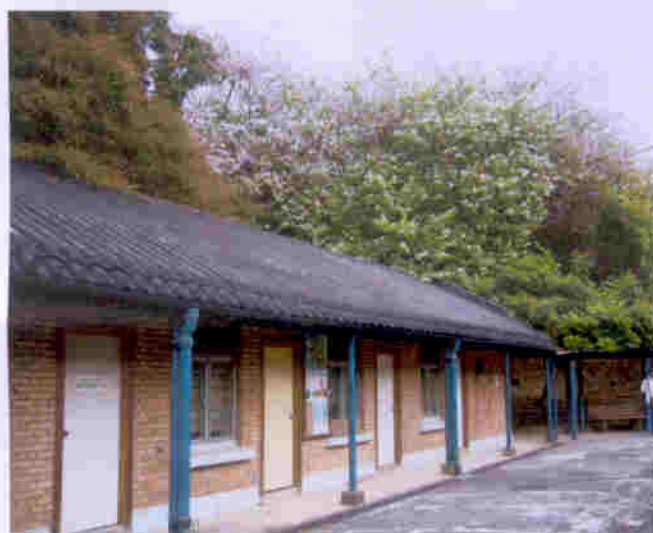
蒸康居有不少單層古雅的红磚屋，被列為三級文物建築物