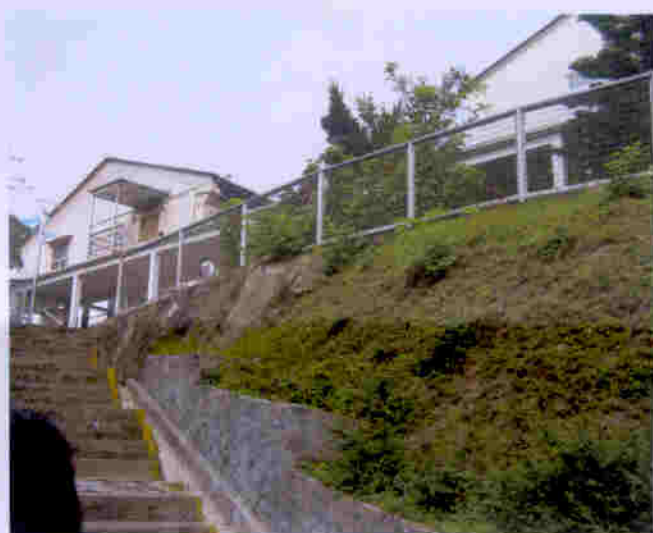
萬康居位於市區，環境清幽古雅，交通方便，堪稱鳥語花香