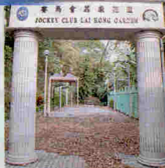
▲戰前軍營花園內廣植亞洲著名觀賞花木，環境清幽。