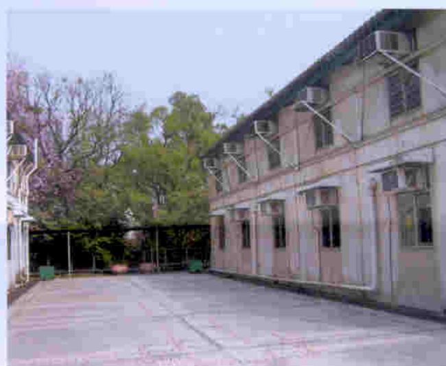
蕙康居的水、電、煤設施完備，全部冷氣機尚可運作