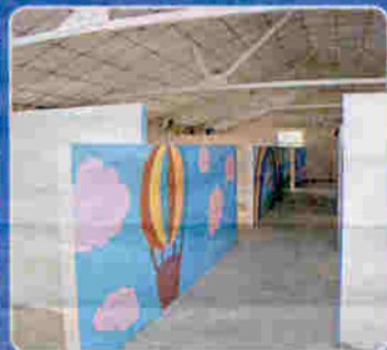
▲2層式樓房設計的戰前軍營，港青粗略估計每座可改建20間房間。

有 83年歷史、前身為軍營的三級歷史建築，繼早前懲教署有意改建為員工宿舍後，近日有機構擬將它改建為青年旅舍，除造就更多職位予弱勢社群外，更可為海外旅客提供價廉物美的旅館，不過一切仍屬初步構思階段，成功與否還需考慮多項因素。