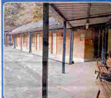
▲戰前軍營其中一組建築物由紅磚建成，適合改建為博物館。