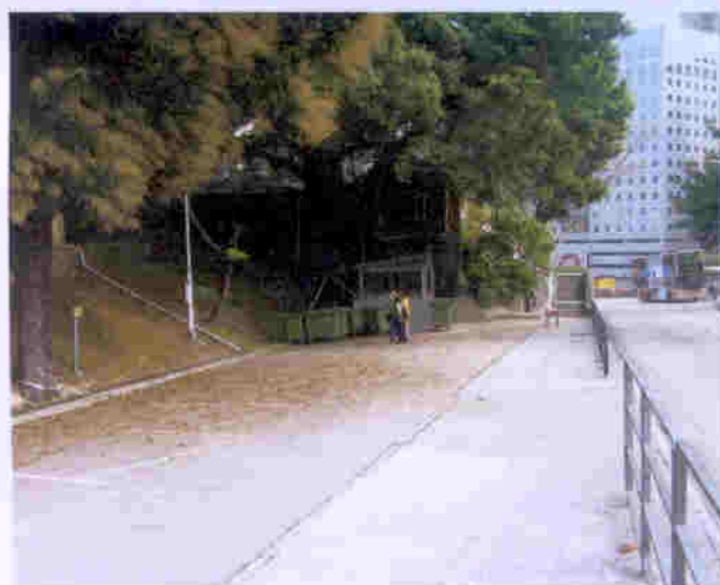
蕙康居有獨立停車場，旺中帶靜，交通方便