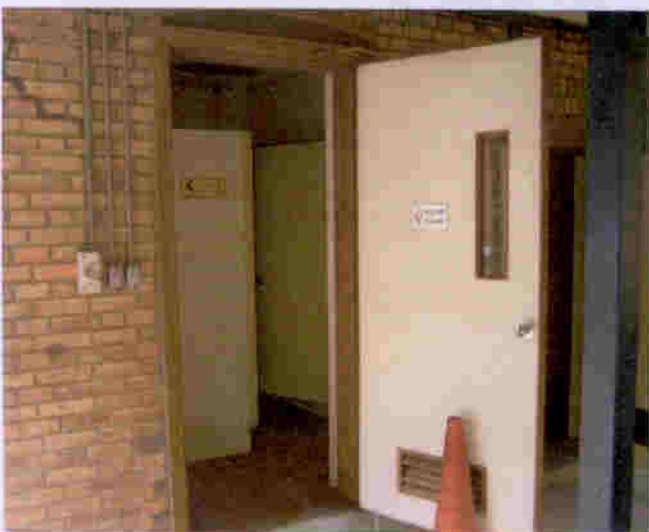
荔康居營房地下層基本情況一樣，設有男、女廁所，保養良好