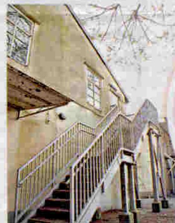
▲若落實改建青年旅館，屆時遊客可有多個住宿選擇。

前身是軍營的荔枝角醫院，已有83年歷史，二次大戰結束後，由軍營改建成麻瘋病人使用的醫院，其後麻瘋病逐漸受到控制，又改為精神科長期護理院荔康居，至04年尾才丟空至今。近日才被古物古蹟辦事處列為三級歷史建築物。