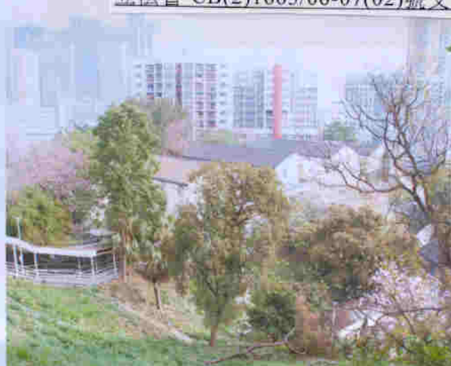
蕙康居位於市區，環境清幽古雅，交通方便，堪稱鳥語花香