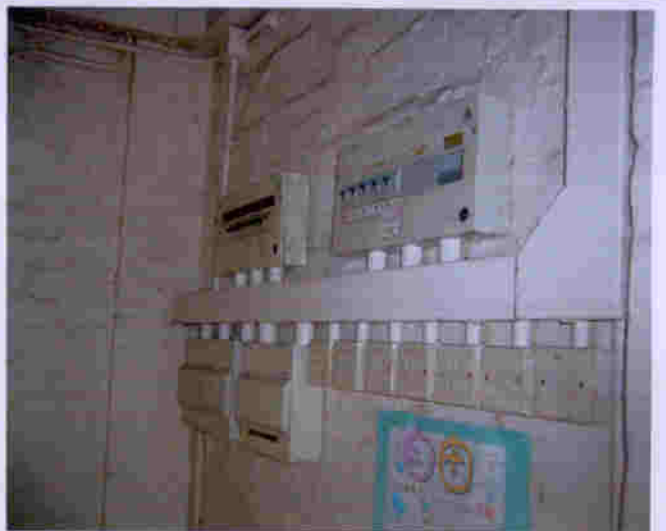
荔康居水、電、煤氣、及消防設施齊備，運作正常