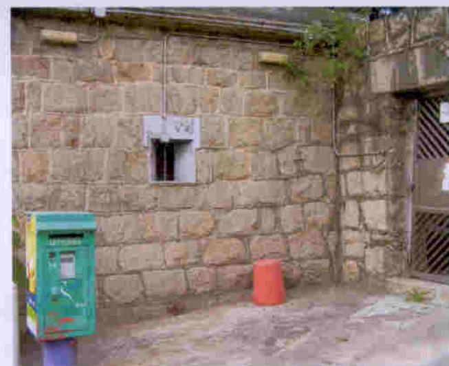
蒸康居大門前設有郵箱，方便旅客郵寄信件