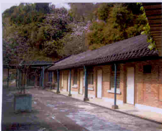
蒸康居有不少單層古雅的红磚屋，被列為三級文物建築物