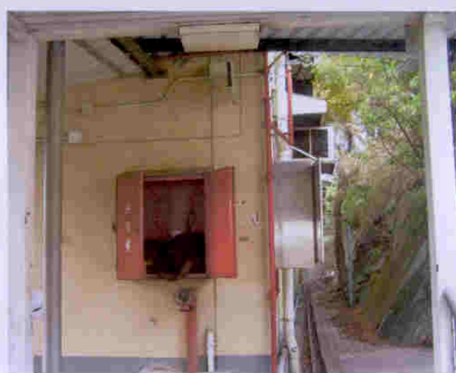
萬康居消防設施齊備，運作正常