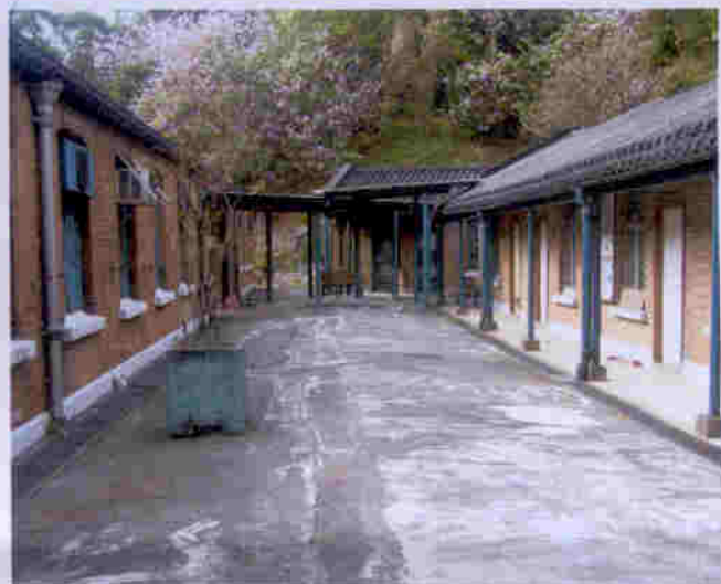
蒸康居有不少單層古雅的红磚屋，被列為三級文物建築物