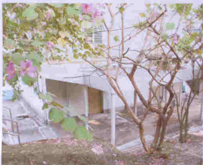
萬康居位於市區，環境清幽古雅，交通方便，堪稱鳥語花香