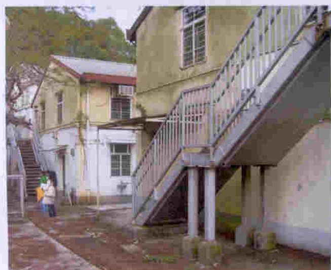
蒸康居全部兩層式建築物前後均有走火警樓梯，符合消防規例