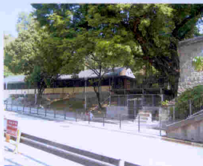
蕙康居有獨立停車場，旺中帶靜，交通方便