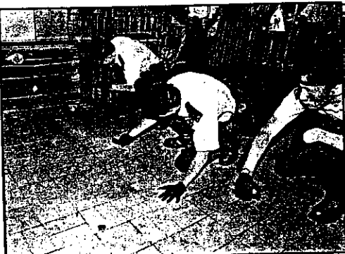
機動部隊人員在兇案現場附近搜索證物。

香港人權監察發表聲明，對何俊仁遇襲事件表示高度關注，強烈譴責暴行，要求政府和警方關注事件，全力徹查。