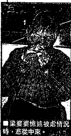
梁婆婆憶述被虐情況時，悲從中來。