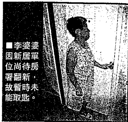
■李婆婆因新居單位尚待房署翻新，故暫時未能取匙。