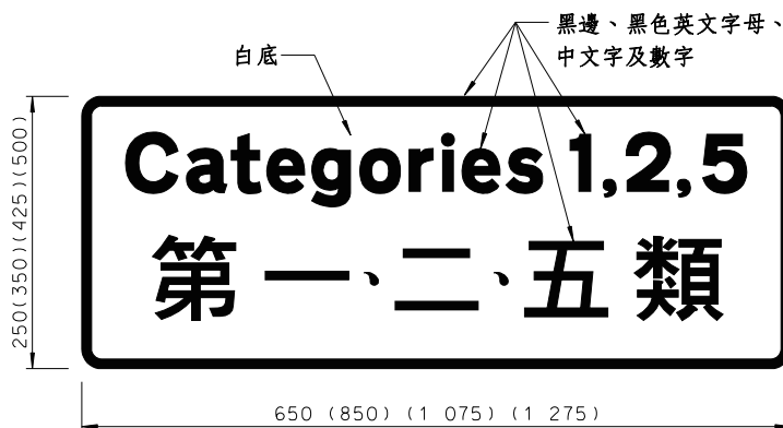
第 434 號圖形

本標誌可連同第 174 號圖形所示的標誌使用，以顯示該圖形所提述的危險品類別。”。