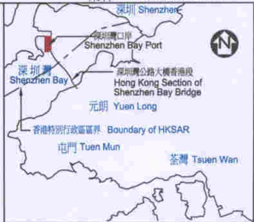
位置圖 LOCATION PLAN