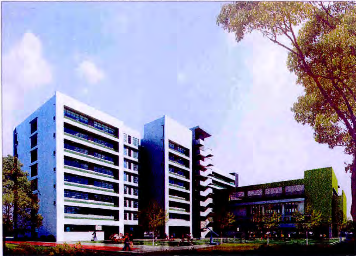
從東北面望向學校校舍的構思圖 VIEW OF THE SCHOOL PREMISES FROM NORTH-EASTERN DIRECTION (ARTIST'S IMPRESSION)