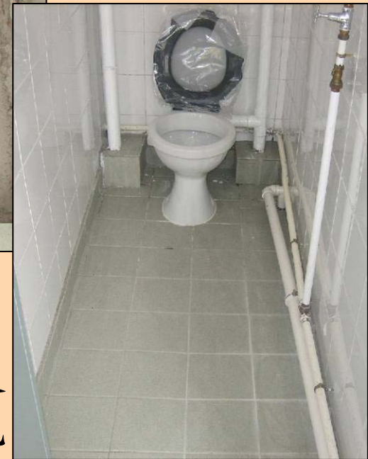
完成後 重鋪地台瓦