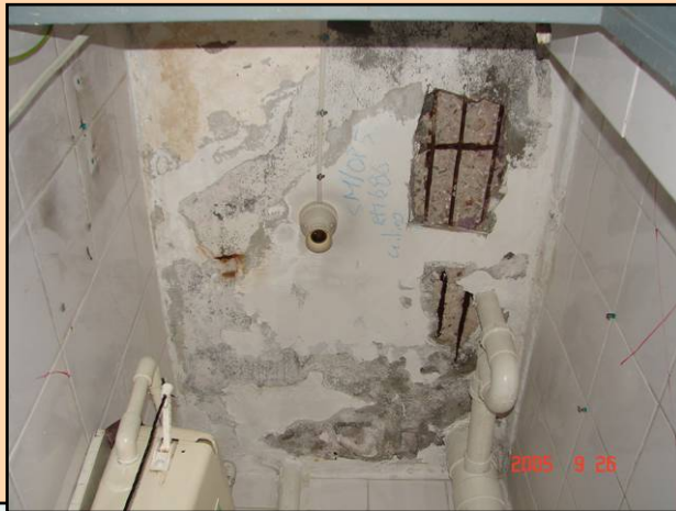
內置式喉管穿 越樓板