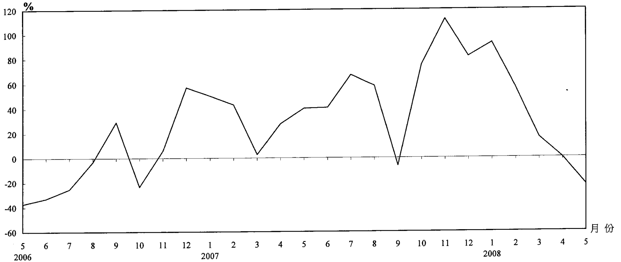
樓宇買賣合約（包括住宅及非住宅單位）數目