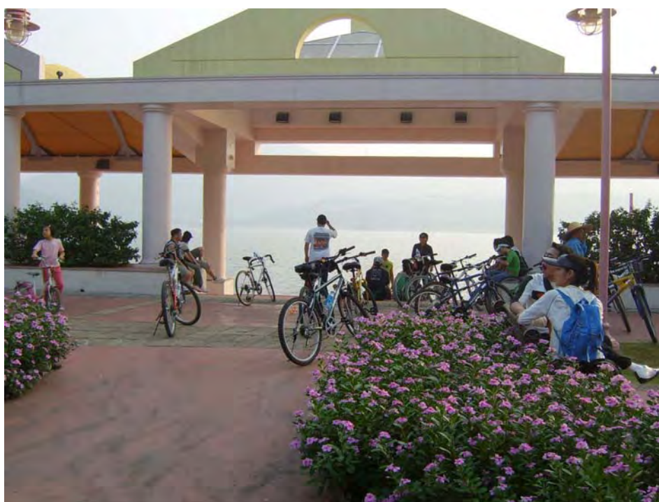
例二：在大埔海濱公園的觀景處