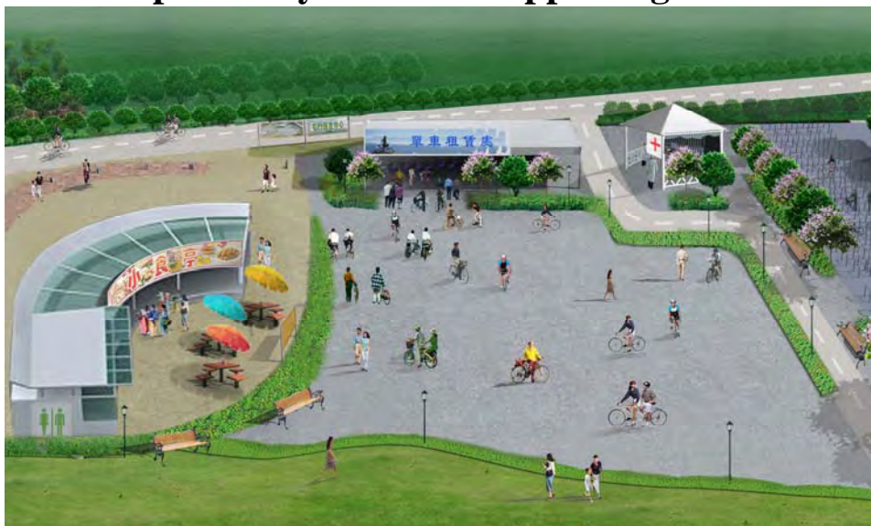
例一：建議的匯合中心