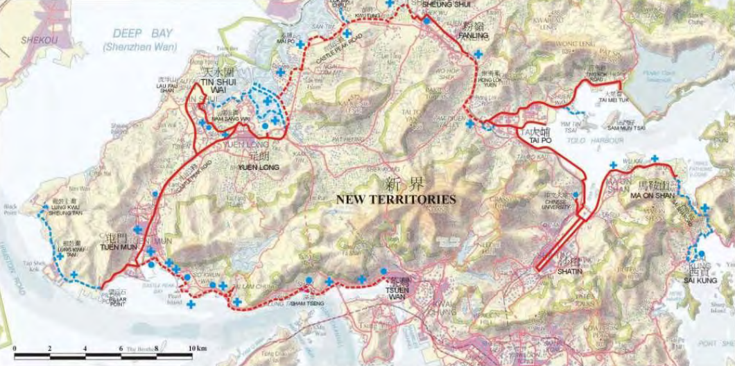
擬建的新界單車徑網絡 PROPOSED CYCLE TRACK NETWORK IN THE NEW TERRITORIES