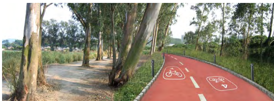
例四：沿單車徑的園境美化工程