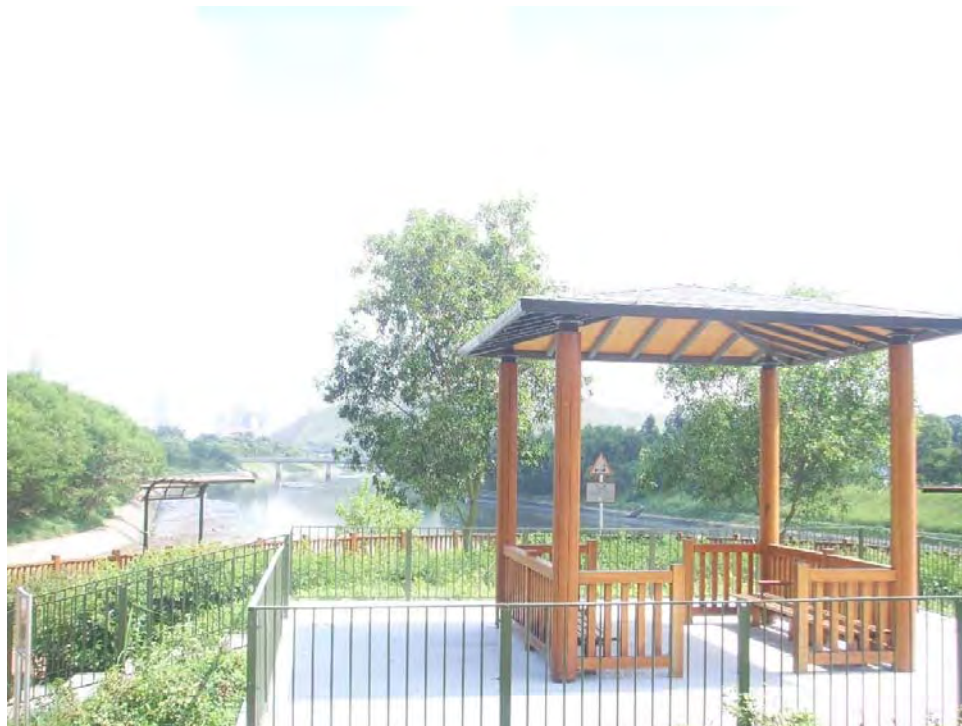
例三：在石上河的休憩處