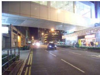
右： 馬鞍山 市中心