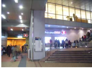
左： 將軍澳 坑口