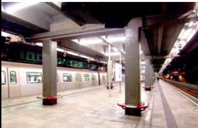
九龍灣站工程完成效果圖