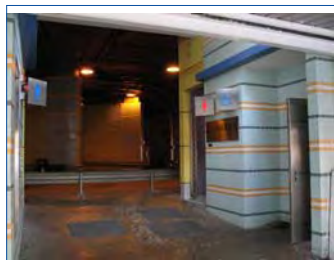
長沙灣站附近、長沙灣遊樂場內的公共洗手間