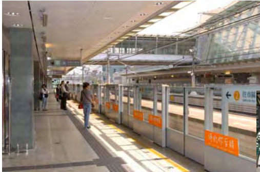
欣澳站東涌綫月台