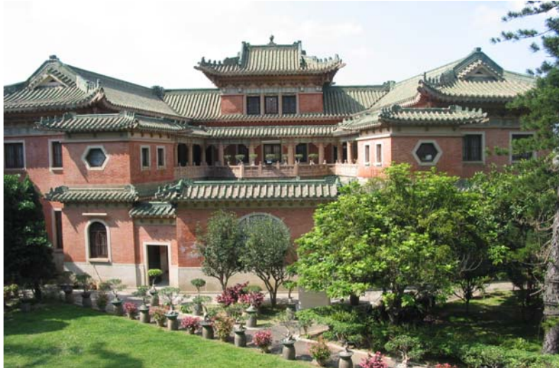
The Building at 45 Stubbs Road