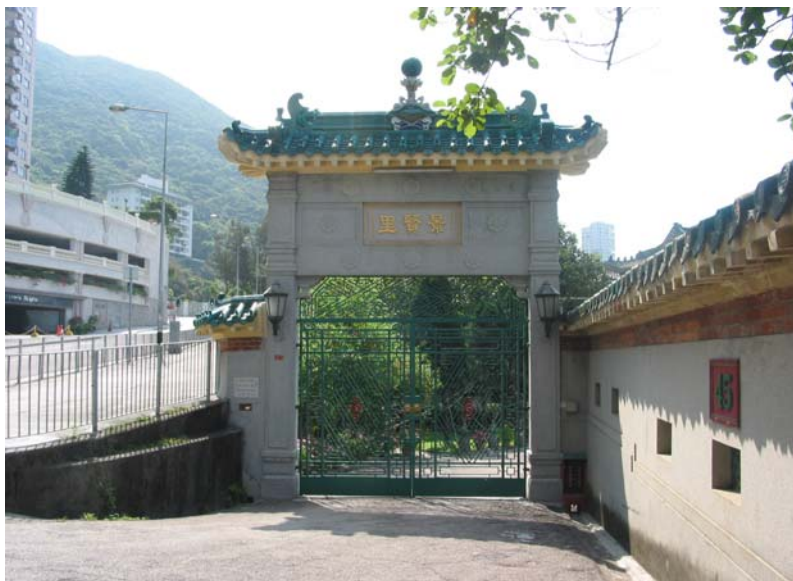
Entrance of the Building