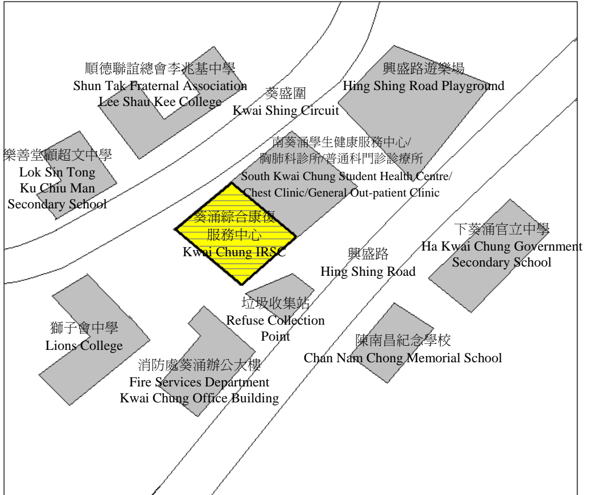
葵涌綜合康復服務中心位置圖