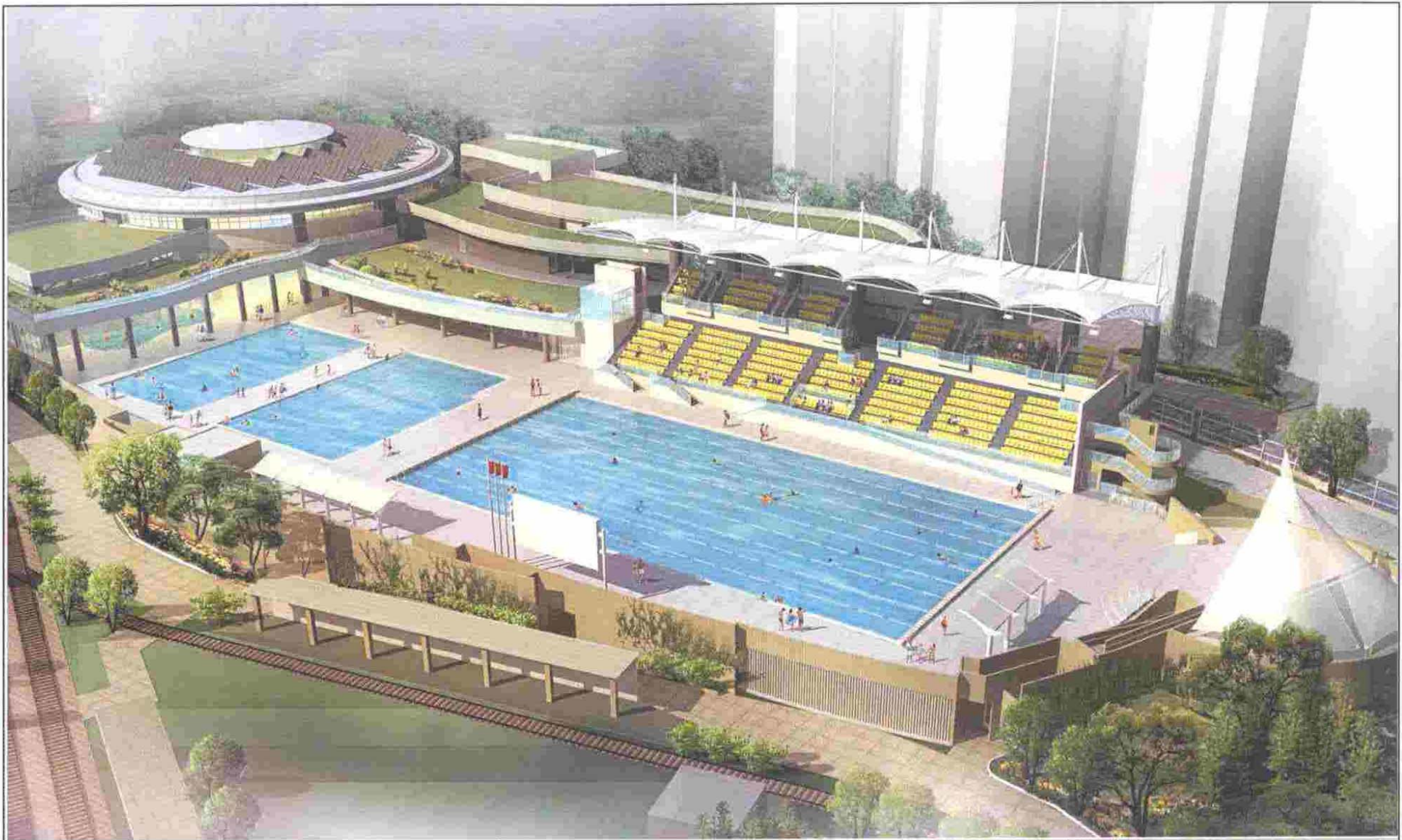
AERIAL PERSPECTIVE OF SWIMMING POOL COMPLEX IN AREA 1 (SAN WAI COURT), TUEN MUN (ARTIST'S IMPRESSION)

264RS SWIMMING POOL COMPLEX IN AREA 1 (SAN WAI COURT), TUEN MUN 屯門第1區 (新圍苑)游泳池場館