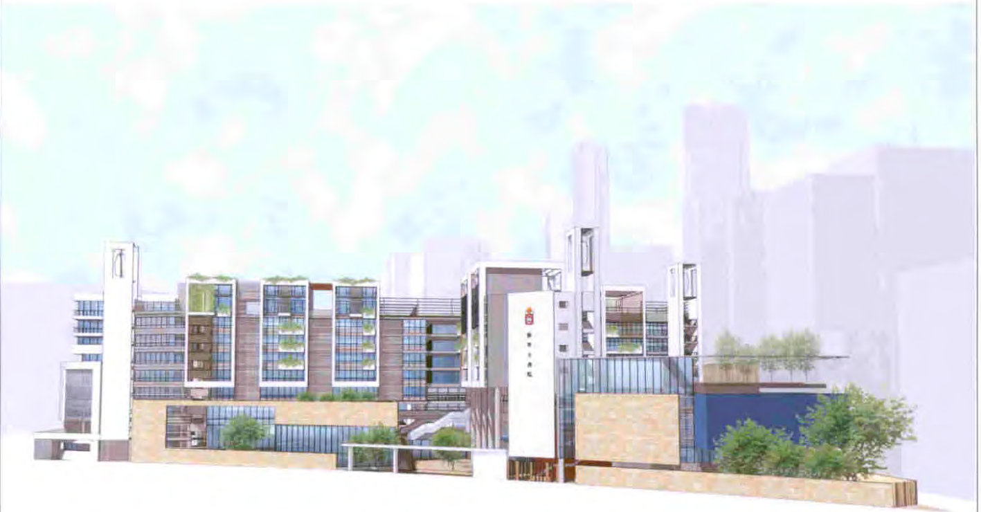
從北面望向校舍入口的構思圖 VIEW OF THE SCHOOL ENTRANCE FROM NORTHERN DIRECTION (ARTIST'S IMPRESSION)