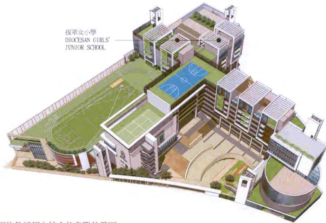
從南面佐敦道望向校舍的鳥瞰效果圖 AERIAL VIEW FROM JORDAN ROAD