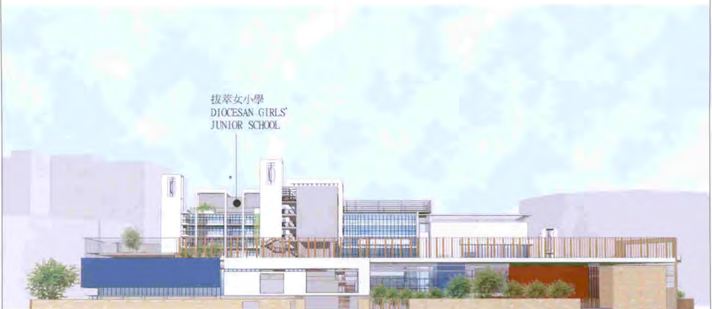
從西面志和街望向校舍的構思圖 VIEW OF THE SCHOOL PREMISES FROM WESTERN DIRECTION AT CHI WO STREET (ARTIST'S IMPRESSION)