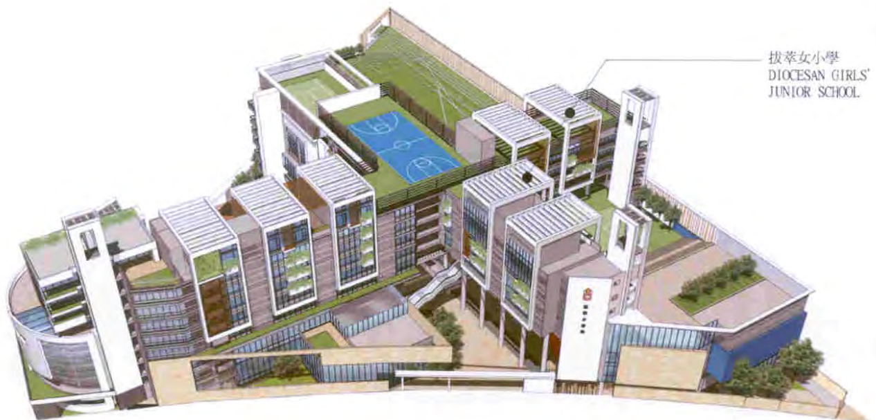
從北面加士居道望向校舍的鳥瞰效果圖 AERIAL VIEW FROM GASCOIGNE ROAD