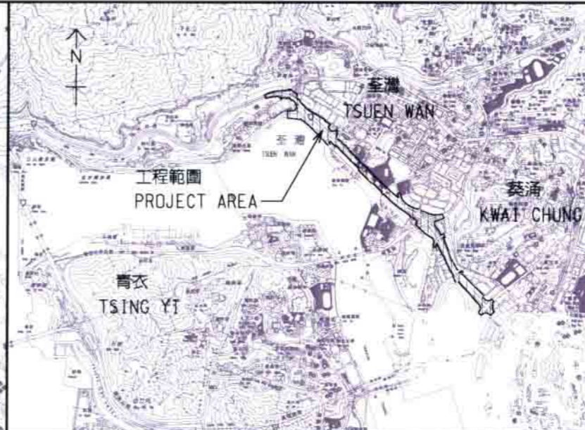
索引圖 KEY PLAN 比例 SCALE 1 : 50 000