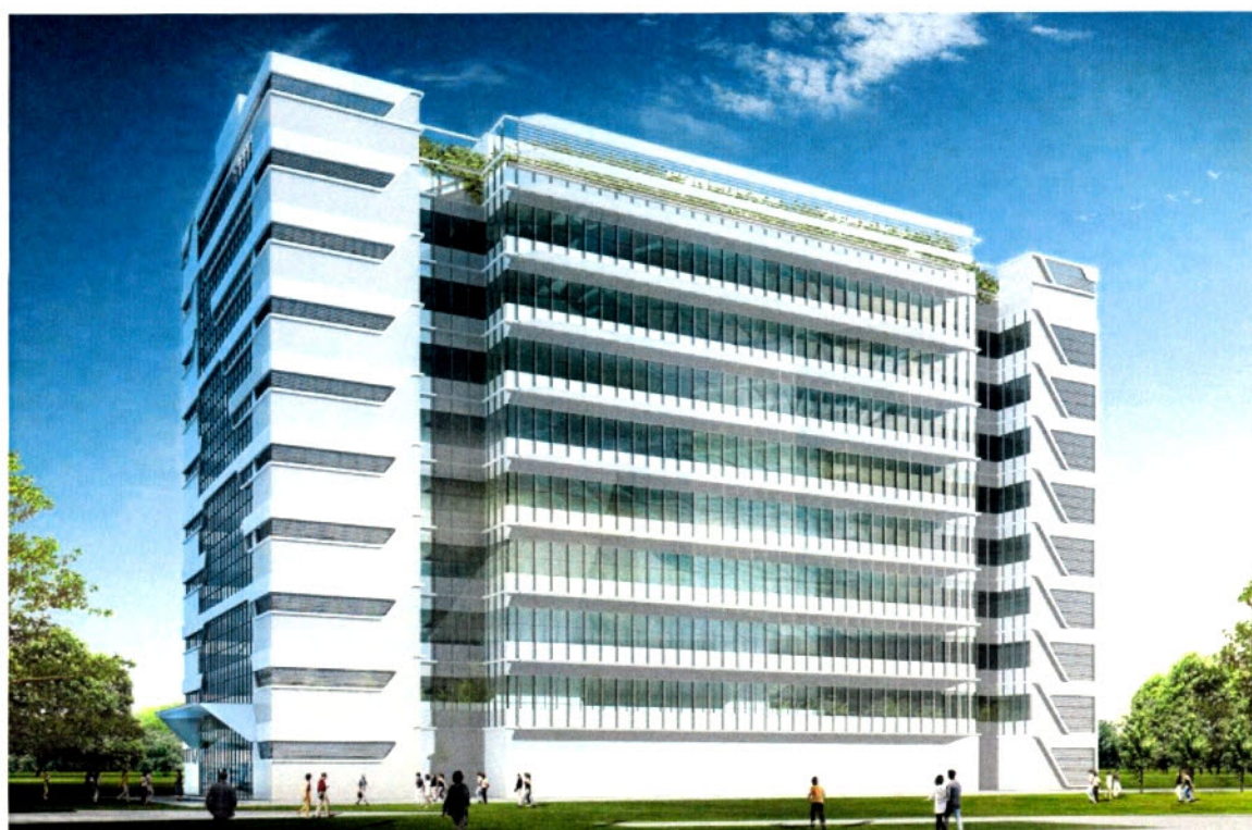
View of the building from northern direction (Artist's impression) 從北面望向大樓的構思圖