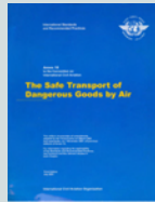
《芝加哥公約》 附件 18 Chicago Convention Annex 18

上述安全要求已詳列於《危險品安全空運技術指令》內，而這文件通常是每兩年更新一次。