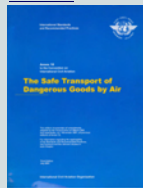
附件 Annex 18