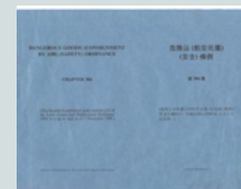
危險品(航空托運)(安全)條例 DG(CAS)R

規管付運人和 貨運代理人 Regulate Shippers and Freight Forwarders