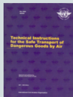
國際民航組織 《危險品安全空運技術指令》 ICAO TI

The above safety requirements are in the “Technical Instructions for the Safe Transport of DG by Air” (TI). This document is normally updated biennially.