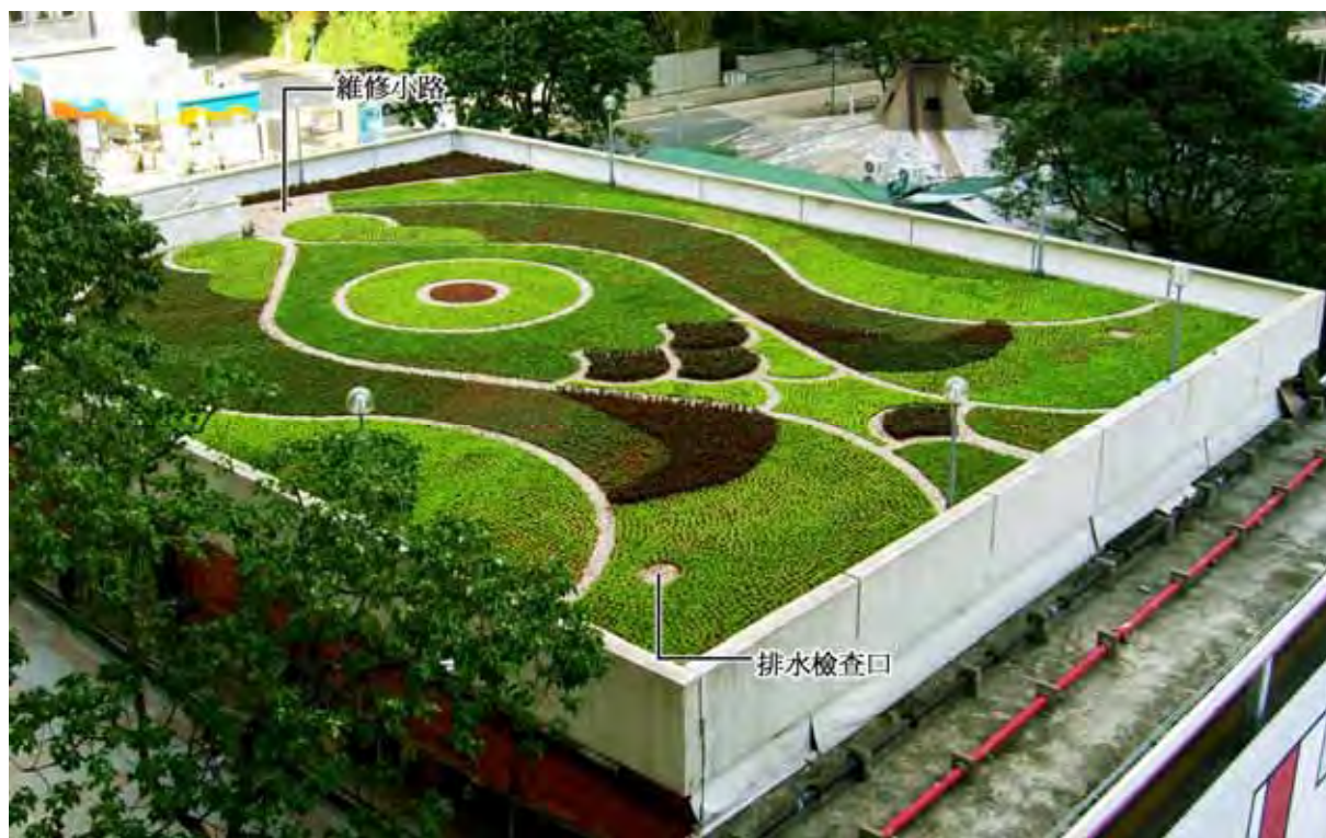
綠化後的天台 - 側面照