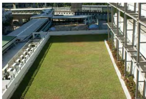
彩雲道地盤(一)第三期