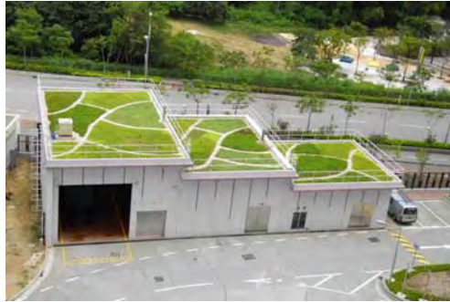
粉嶺 36 區第一、二期

我們在粉嶺 36 區第一、二期項目的廢物收集站屋頂種植了景天屬植物，並進行長期觀察。這類植物只需低度護養，但可選擇的品種暫時有限。