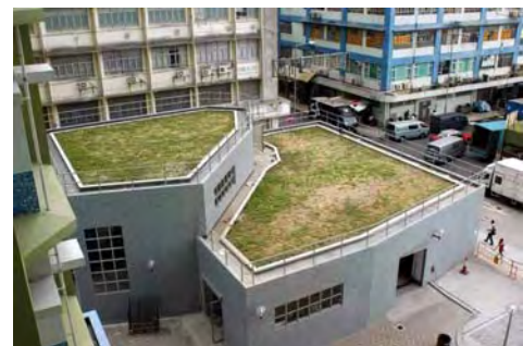
元州邨第二及四期