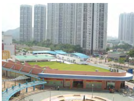
天水圍 103 區第二期

如天台面積比較廣闊，我們可鋪蓋草被。天水圍 103 區第二期和彩雲道地盤(一)第三期的商場天台就採用了草被綠化。大面積草地能有效減低反光和熱力輻射。