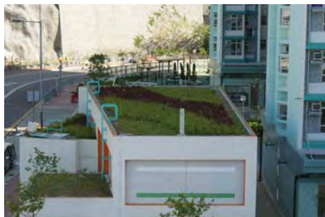
彩雲道地盤(一)第一期

我們在四個屋邨的小型建築物的屋頂種植了小灌木和地被植物。爲了進行綠化工程，我們加強了該些屋頂的承重能力。小灌木和地被植物綠化需要較多護養，如灌溉和修剪等工作。但是這類植物可供選擇品種較多，且可多用原生植物(即本港已有的品種)。