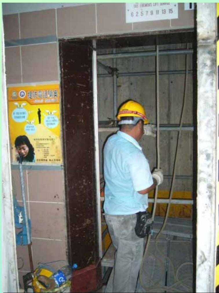
正在更換現有升降機