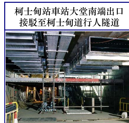
柯士甸站車站大堂南端出口接駁至柯士甸道行人隧道