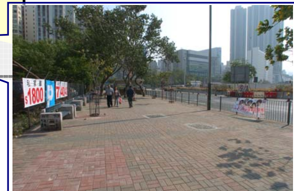
佐敦道行人天橋往佐敦道方向