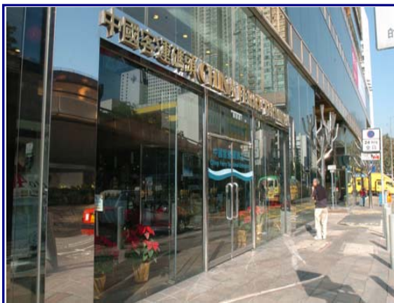
沿廣東道往中港城及中國客運碼頭