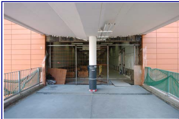
柯士甸站一樓北端出口 接駁至佐敦道行人天橋