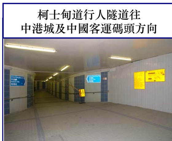
柯士甸道行人隧道往中港城及中國客運碼頭方向