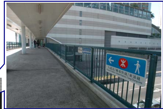
佐敦道行人天橋往九龍站方向