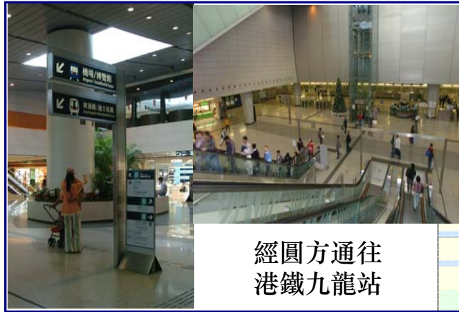
經圓方通往 港鐵九龍站