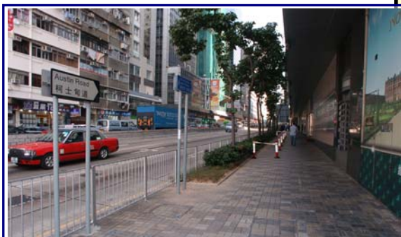
柯士甸道行人隧道往柯士甸道、港景峯及九龍公園方向