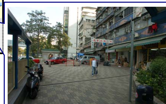
柯士甸道行人隧道往寶靈街及港鐵佐敦站方向