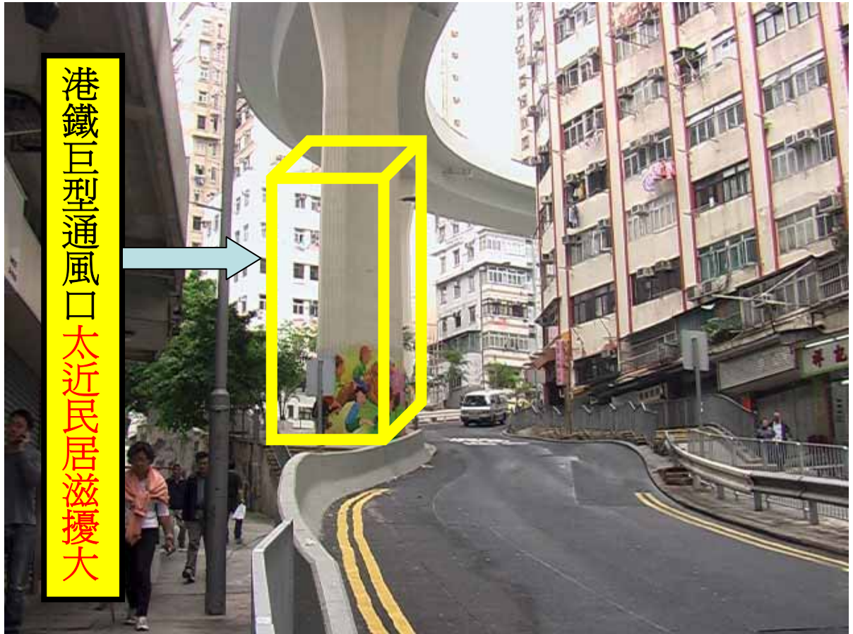
港鐵巨型通風口太近民居滋擾大